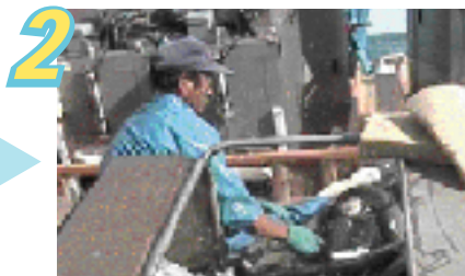
2 上がってきた魚をしめ機の中に入れます