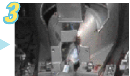
3 入ってきた魚を動かない様に押さえ込みます