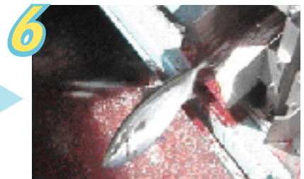
6 払い出された魚は水の入った魚槽に直接落とされます