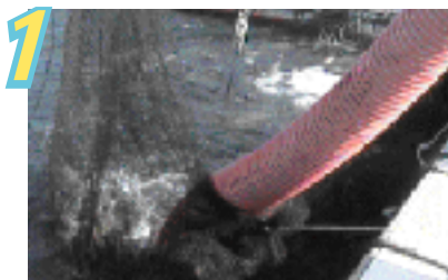
1 フィッシュポンプで魚を吸い上げます