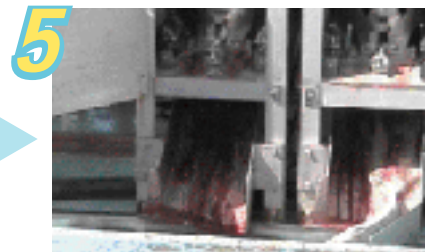
5 しめた魚を払い出します